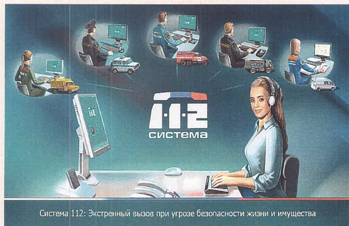
Система 112: Экстренный вызов при угрозе безопасности жизни и имущества

Вы должны ответить на все вопросы, главное будьте спокойны.